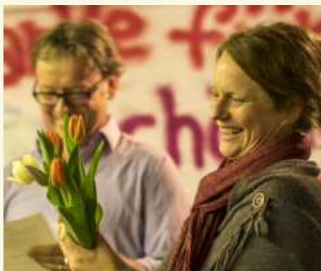
Blumen und Dank zum Abschied

Danke Jungs, weiter so! Nächstes Jahr holen wir uns den Pokal zurück, oder?!